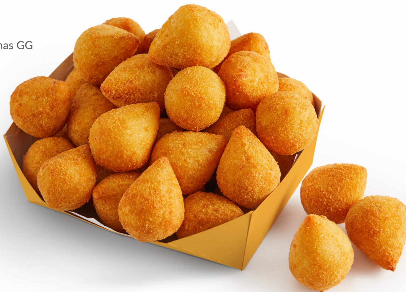
Mini Coxinhas GG