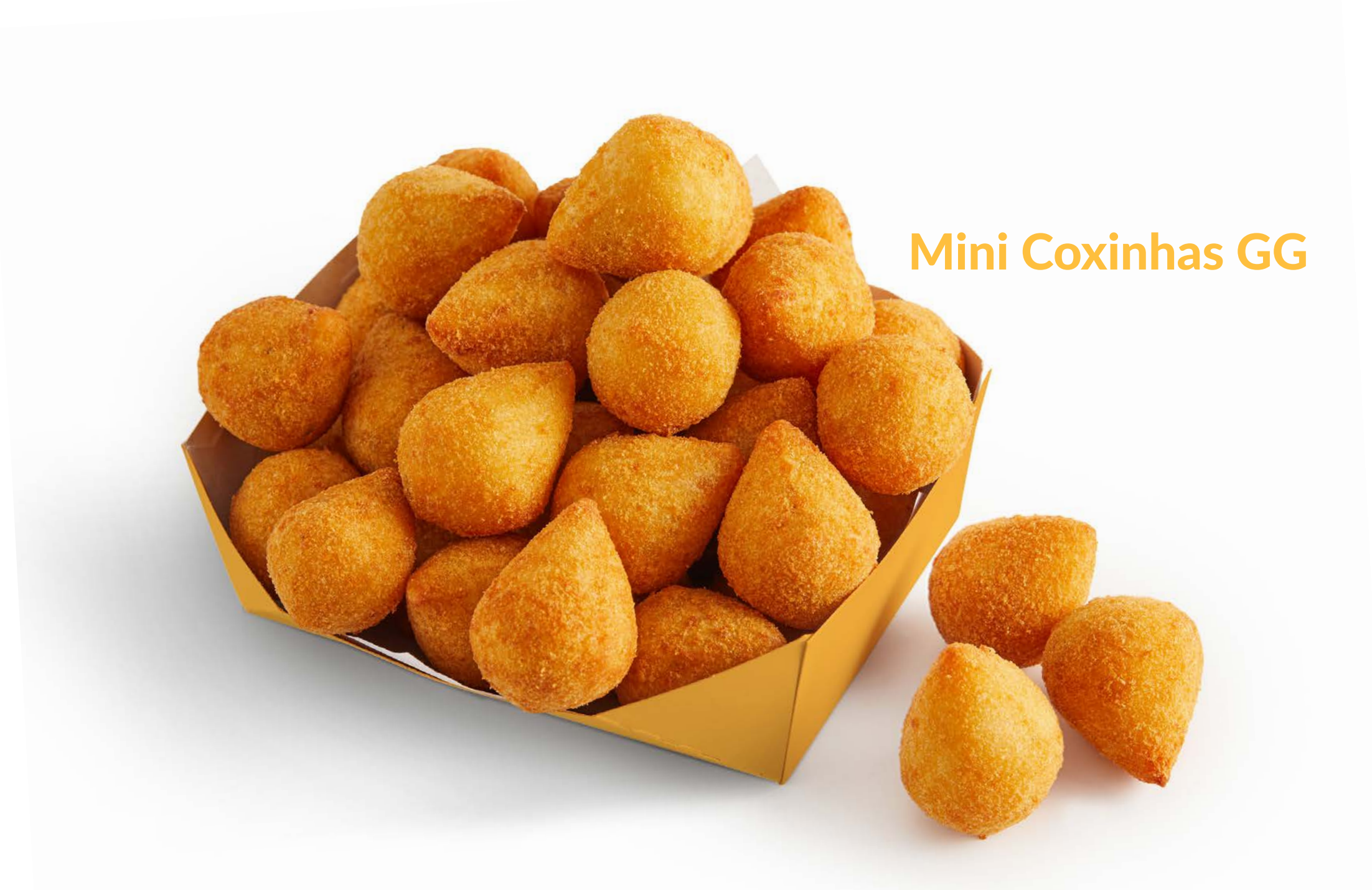
Mini Coxinhas GG